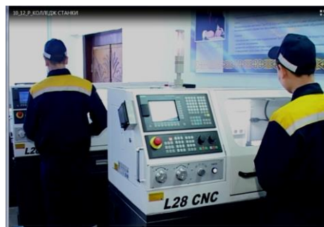
Студенты Машиностроительного колледжа проходят учебную практику на станках с ЧПУ

Главным и основным партнёром колледжа по программе внедрения дуальной системы является АО «Петропавловский завод тяжелого машиностроения».