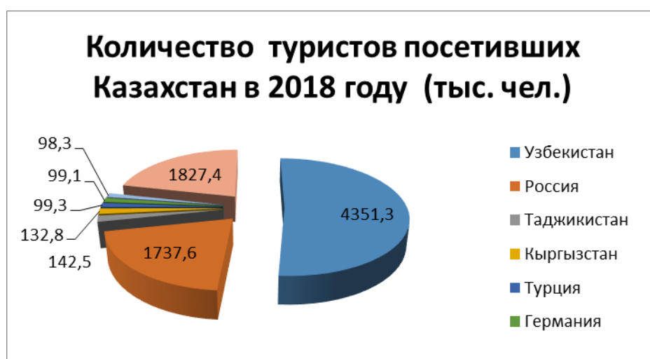
Рис.1 Количество туристов, посетивших Казахстан в 2018 году в тыс. человек

Доля иностранных туристов весьма невелика, особенно дальнего зарубежья.