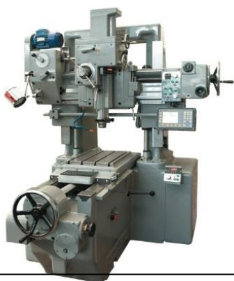
Координатно-расточной станок модели JBD3 MITSUI SEIKI

Такие агрегаты комплектуются особым отсчетным устройством. Оно позволяет достигать высокой точности обработки заготовки. Погрешность при создании отверстия не превышает 1 микрометра. Координатно-расточные станки оснащаются специальным устройством контроля отклонений, и работа на них делается фактически ювелирной.