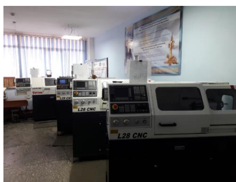
Станочный цех станков с ЧПУ